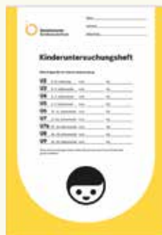
So sieht ein „U-Heft“ aus.

Diese Untersuchungen sind sehr wichtig. Bitte nehmen Sie deshalb all diese Untersuchungen wahr und bringen Sie immer das Untersuchungsheft („U-Heft“) sowie den Impfpass Ihres Kindes mit. Die Untersuchungen dienen der Gesundheit Ihres Kindes.