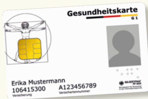
Musterbeispiel einer Gesundheitskarte

Bitte nehmen Sie immer Ihre elektronische Gesundheitskarte mit, wenn Sie Gesundheitsdienste in Anspruch nehmen. Seit dem 1. Januar 2015 gilt ausschließlich diese Karte als Berechtigungsnachweis, um Leistungen der gesetzlichen Krankenversicherung in Anspruch nehmen zu können. Auf der elektronischen Gesundheitskarte sind Ihr Name, Ihr Geburtsdatum und Ihre Anschrift sowie Ihre Krankenversicherungsnummer und Ihr Versichertenstatus (Mitglied, Familienversicherter oder Rentner) als Pflichtdaten gespeichert. Die elektronische Gesundheitskarte enthält außerdem ein Lichtbild von Ihnen.