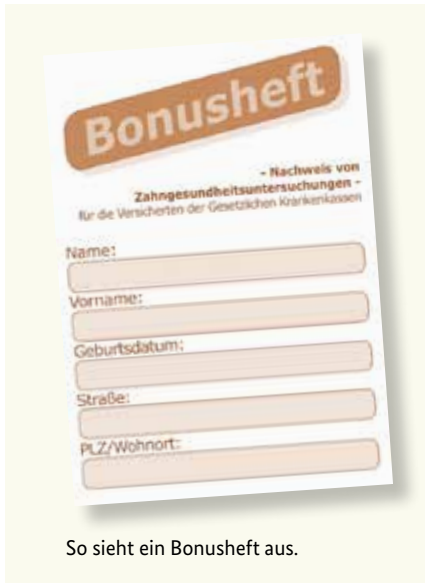
So sieht ein Bonusheft aus.

Gesunde Zähne sind ein Stück Lebensqualität. Deshalb sind regelmäßige Vorsorgeuntersuchungen wichtig – auch wenn Sie keine Beschwerden haben. Die gesetzlichen Krankenkassen übernehmen auch die Kosten dieser Vorsorgeuntersuchungen. Diese Untersuchungen helfen, bestimmte Erkrankungen frühzeitig zu erkennen und zu behandeln. Sie können dafür von Ihrer Krankenkasse ein sogenanntes „Bonusheft“ erhalten. In diesem Heft werden die Vorsorgeuntersuchungen eingetragen. Wenn Sie nachweisen können, dass Sie mindestens einmal im Jahr (unter 18 Jahren mindestens einmal pro Halbjahr) bei einer Zahnärztin oder einem Zahnarzt waren, zahlt die Krankenkasse einen höheren Zuschuss, sofern ein Zahnersatz notwendig wird.